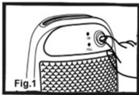
Obr. 1 - zapnutí spotřebiče

Tento odvlhčovač pracuje bez kompresoru, díky čemuž je lehčí a tišší. Je vhodný pro malé místnosti. Špatné větrání může způsobovat zatuchlý zápach a vznik plísní ve skříních nebo komorách; tento přístroj pomáhá omezit vlhkost v místnosti.